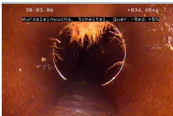
Abb. 3: Wurzeln, die in die Abwasserleitung einwachsen, müssen entfernt werden, sonst verstopft die Leitung. In diesem Beispiel ist die Sanierungspriorität mittel bis hoch.

Das Prüfprotokoll mit allen Anlagen gehört zu den Hausakten. Außerdem sollte das Prüfergebnis der Kommune mitgeteilt werden, auch wenn keine Schäden festgestellt wurden.